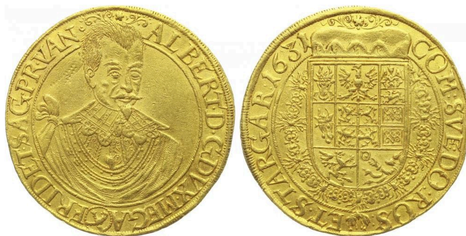
Čechy / Albrecht z Valdštejna / 10 dukát 1631 / 3 042 000 Kč / Aurea Numismatika 7. 12. 2013

První aukční den, v sobotu, šla do dražby řada převážně vysokých dukátových nominálů. Pozornost upoutal především unikátní saský 20 dukát 1610, jedinečný nejen vzácným výskytem, ale i nezvyklou zachovalostí. Z vyvolávací ceny 2,5 milionu vystoupal až na neuvěřitelných 7,6 milionů korun (všechny ceny včetně přírůžky) a zařadil se tak na první místo v historické tabulce nejdražše prodaných mincí v českých aukcích všech dob. Překonal tak desetiletí starý rekord ruského zkušebního rublu carevny Anny z roku 1730 z tzv. Prokopovy sbírky, který se v roce 2003 prodal za 5,5 mil. Kč.