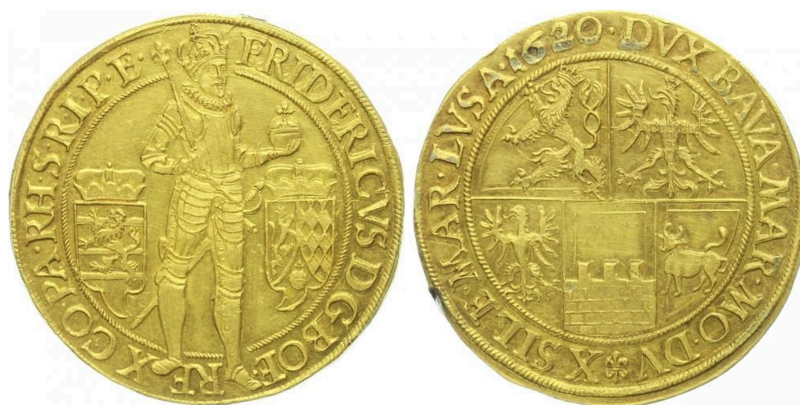
Čechy / Fridrich Falcký 10 dukát / Praha 1620 - Karel Škréta / 4 738 500 Kč / Aurea Numismatika 7. 12. 2013

Další miliónové dražby z této aukce jsou dva 10 dukáty - zimního krále Friedricha Falckého a vévody Albrechta z Valdštejna s dosaženými cenami 4,7 a 3 miliony korun (v žebříčku nejdražších v tuzemsku vydražených mincí obsadily 3. a 5. místo). Za 1,17 milionu korun se pak prodal vzácný pražský talar Ferdinanda II. z roku 1630, pravděpodobně zkušební nebo darovací mince. V navazující odpolední aukci antických mincí byl nabízen vyvážený soubor od keltských až po byzantské mince, zájem sběratelů byl i zde nad očekávání dobrý. Nejdražší prodanou mincí byl aureus Sexta Pompeia s cenou 1,28 milionu korun, velmi dobře se prodávaly i další zlaté mince, zájem byl i o stříbrné mince ve všech cenových hladinách.