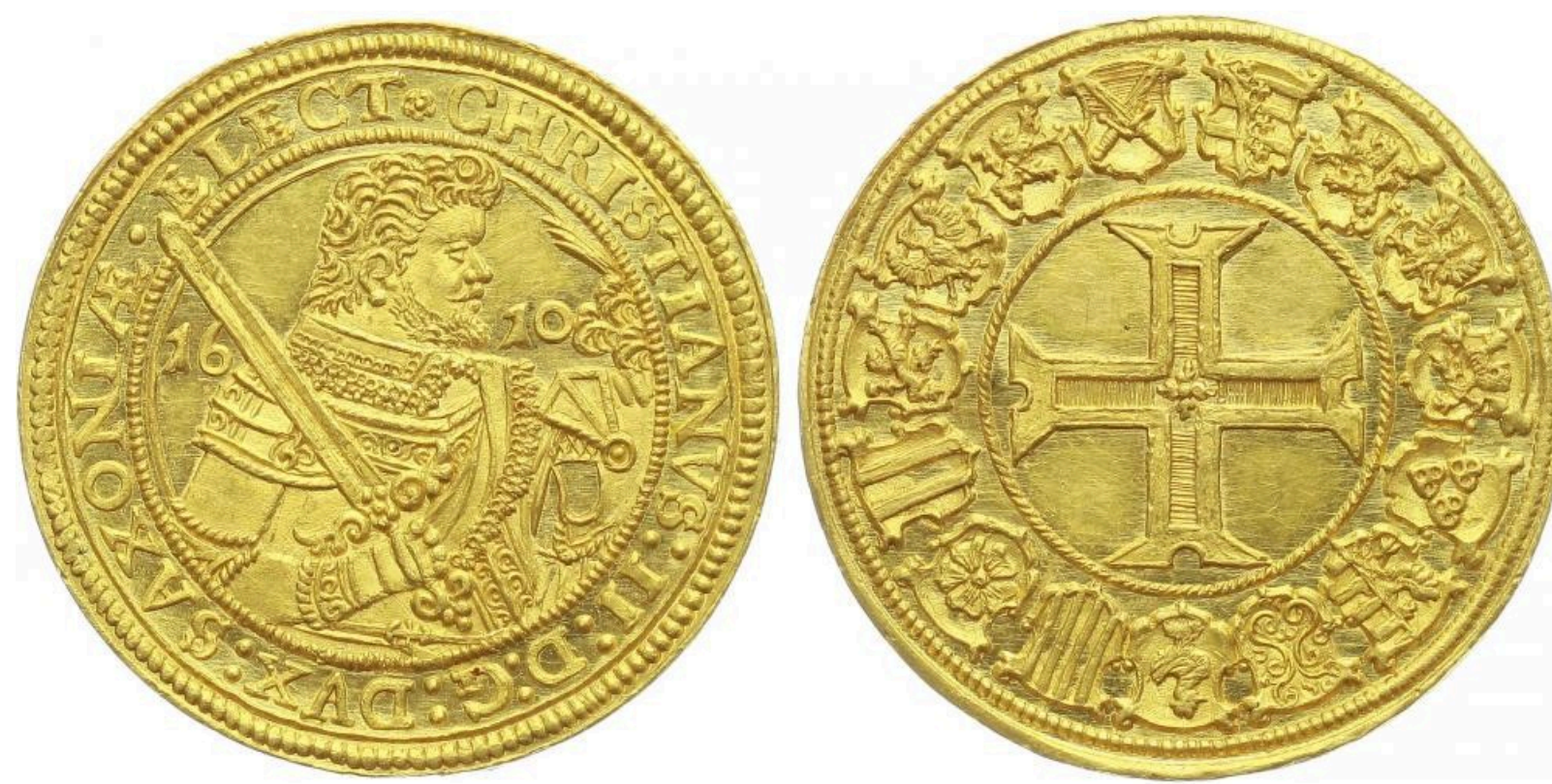
Sasko / Christian II / 20 dukát - 2 Portugalésler 1610 / 7 605 000 Kč / Aurea Numismatika 7. 12. 2013

Rekordy v uplynulém roce padaly nejen na trhu s výtvarným uměním. Z výrazných úspěchů se těšila i česká numismatika. Prosincové aukce Aurea Numismatika překonaly všechna očekávání. Zebříček historicky nejdražších v tuzemsku prodaných mincí přepsaly během dvou dnů na předních čtyřech pozicích v první desítku. Překonán byl i deset let starý numismatický rekord.