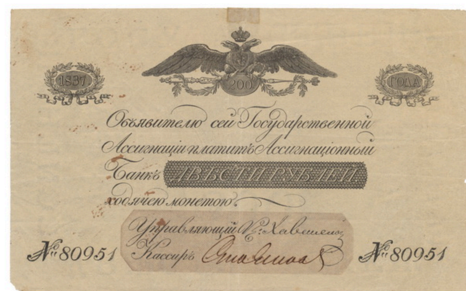
Rusko / 200 Rubl 1837 / 3 042 000 Kč / Aurea Numismatika 8. 12. 2013

V neděli 8. prosince aukce pokračovaly dražbou výjimečně kvalitní sbírky ruských papírových platidel. I zde padlo několik rekordů. Zájem ruských sběratelů o vzácné nabízené bankovky v nadprůměrné zachovalosti byl obrovský. Dosažené ceny tomu odpovídaly. Obdobný soubor ruských papírových platidel je i v rámci sbětového sběratelského trhu do značné míry unikátní. Nejdražše prodanými bankovkami byly 200 Rubl z roku 1837 s cenou 3 miliony korun, 25 Rubl 1840 za 2,4 miliony korun, 25 Rubl 1843 a 25 Rubl 1875, oba po 877 tisících korunách.